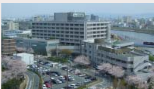
図表1 ● 恩賜財団大阪府済生会吹田病院の概要