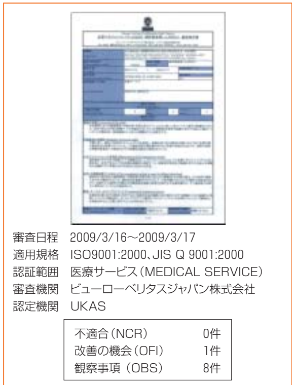
図表3●QMS維持審査報告(直近)

評価は2006年に更新し（図表2）、来年に2度目の更新を予定している。ISO9001は2度更新し、現在、2008年11月に発行された2008年版の規格に対応すべく準備中である。