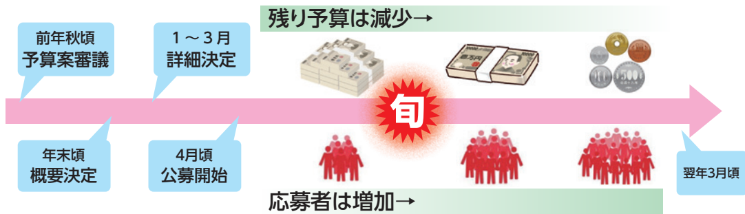
● 図表 3 補助金等事業の年間スケジュール