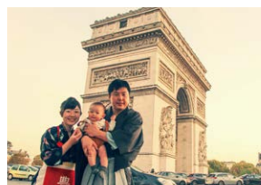
家族で営む小さな茶園が実現させた 日本初のオーガニック抹茶、 人と環境を思う心は世界へ いしかわ製茶

環境省が主催するグッドライフアワードは、環境と社会によい活動を応援するプロジェクトです。社会をよくするSDGsを体現する取組を「環境大臣賞」として幅広く表彰しています。企業、学校、NPO、自治体、地域コミュニティ、個人など、どなたでもエントリー可能です。