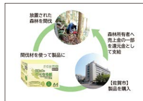
「木になる紙」の 地産地消によるネイチャーポジティブ ～地域振興に貢献～ 佐賀市