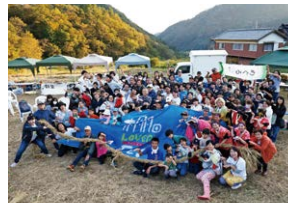
生物あふれるいのちの棚田を 未来の子どもたちにつなぎ、 約20年間多様な主体と連携・協働 特定非営利活動法人棚田LOVERS