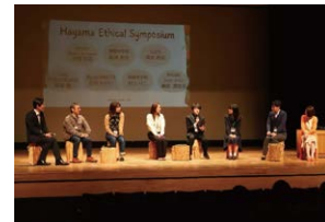
エシカルタウン・葉山 ～町民全員で創る、 持続可能な新しい常識～ 葉山町