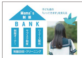
子どもたちの「いってきます」を支える！ 全国初「制服オーナー制度」『サブスク』を取り入れた 制服リユース「Mama's 制服バンク」事業 特定非営利活動法人Mama's Cafe