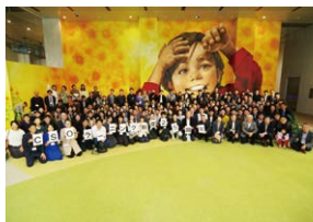
「CSOラーニング制度」による 環境人材育成の取組み 公益財団法人SOMPO環境財団