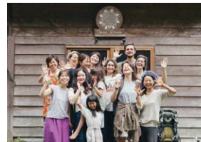
福島から始まる、人と地球を健康にする 里山再生モデル事業 ～世界とつながる体験型エコビレッジの挑戦～ Dana Village(ダーナビレッジ)