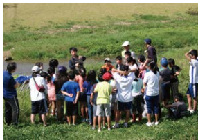
人と地域と自然をつなぐ 流域再生の実践— 多主体共創で拓く心豊かな未来 九州大学流域システム工学研究室