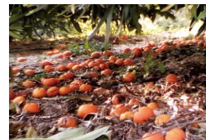
日本の「明るい農村」を、 MOTTAINAIをつかって 創造再生させてきた15年の軌跡 静岡県浜松市 三ヶ日観光協会